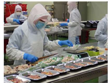
食卓の笑顔に思いを馳せて…

鶏肉は、畜肉よりもどちらかと言えば魚肉のように鮮度に対してデリケートな食材です。屠鳥・解体・包装・出荷まで、幾多の工程で低温管理に配慮し、スピーディーに製品化しています。その一方で、業界で評価の高いデンマーク製の処理機械を使用しながらも、個体差がある鶏を機械だけに頼って最終製品に仕上げることは難しく、最終的にはオペレーター一人一人の触手、目視により、細心の注意を払って製品を仕上げています。折角いただいた鶏の命を、決して無駄にすることがないように、従業員が心を一つにして日々製品づくりに取り組んでいます。