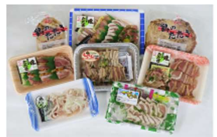
刺身・たたき商品