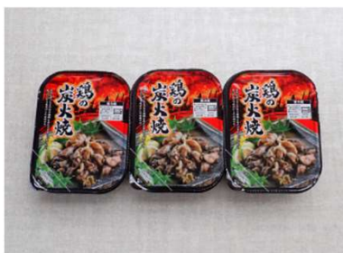
新商品「鶏の炭火焼80g」