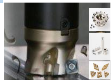
工業用精密ナイフ・切削工具

機械工具は、切削工具事業から空圧工具・電動工具事業まで、総合機械工具メーカーとして幅広い市場に対応しており、川内工場は、グローバルに展開する切削工具事業のマザープラントとして、『切削工具』『工業用ナイフ/耐熱・耐摩耗部品』の開発・製造を行っています。耐摩耗性に優れる素材 ファインセラミックス、超硬合金、サーメットなどの材料開発とコーティング技術から生まれた独自の切削工具は、自動車産業、建設機械、造船業、航空機産業の金属加工の現場で重切削から精密加工まで、さまざまなプロセスで生産性向上に貢献しています。