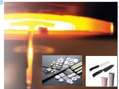
電子工場用・産業用機械部品／応用商品

高純度に精製・合成された原料を用い、高度に制御された環境において高温で焼き上げることにより生まれるファインセラミックス。テレビのブラウン管に使用されるU字ケルシマ管から始まりその後、電気機器・デバイス用部品に代表される電子工業用部品や産業用機械部品、情報機器関連部品、装飾部品とセラミックスのもつ特性を活かし、その用途を拡げてきました。ファインセラミックスは私たちの生活を楽しく快適にする生活用品のアイテムにも活かされています。京セラのセラミック包丁は、その強度と破壊靱性を兼ね備えた材料の開発、シミュレーション技術を活用して、欠け難い形状をデザインしています。