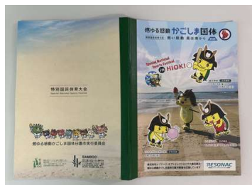
ボランティア協賛の竹紙ノート