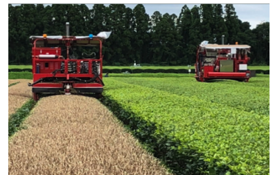
ロボット機による中切&摘採作業

今後、全国の茶園で使用できるよう、付加技術や安全対策の実装を進め、ロボット技術開発を通じて日本の伝統文化であるお茶の振興に貢献するとともに、世界と戦える茶生産体系の構築を目指します。