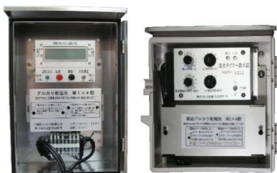
防霜散水器、灌水タイマー散水器