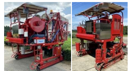
ロボット摘採機・中切機