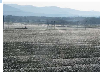
防霜散水状況(茶畑氷結)