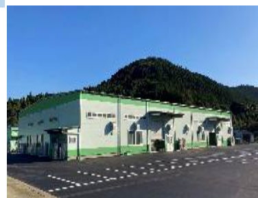
鹿児島工場 第三工場

2021年12月末に鹿児島第三工場が完成、稼働を開始しました。特に医療機器(生化学分析装置部品、レントゲン装置部品等)や印刷機器(商業用大型印刷装置部品等)、電子機器(表面実装機部品等)関連の部品製造を中心に、更なる増産要求に対応するためにマシニングセンターやNC旋盤等の工作機械を多数導入し、生産能力を大幅に増強致しました。これにより現在のお客様への増産要求へ対応可能となるだけでなく、新たな生産供給体制も構築されました。これからも皆様から信頼される企業を目指し、社会の進歩、発展、環境に貢献し、成長してまいります。