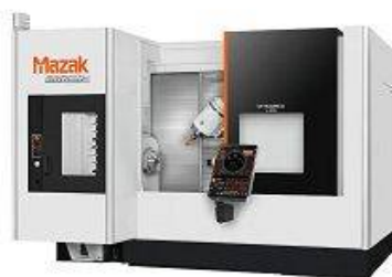
Mazak Integrex j300