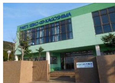
鹿児島工場 第一工場

当社は、金属切削加工において高い技術力を有しており、多品種、小ロット生産に特化、切削加工・機械加工からアッセンブリー、表面処理までの自社一貫生産体制を構築しています。鹿児島工場をはじめ、国内に3拠点(鹿児島県、埼玉県、福島県)、海外2拠点(中国、フィリピン)で計800台以上の工作機械を有しています。同一機種や同性能の機械装置を採用しており、お客様への安定した供給体制を構築しております。国際規格「ISO:9001」を認証取得し、よりお客様に信頼と満足のいただける製品の提供に継続して取り組みます。