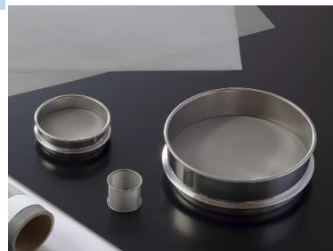
篩(ふるい)フィルター用メッシュ

長年培った技術力で篩(ふるい)・フィルター用金属メッシュを生産しています。高抗張力の金属メッシュは耐摩耗性、ふるい効率に優れており、幅広いラインナップがあります。篩用途において最も目の粗いメッシュで62mesh(目開き250 \mu m)、最も目の細かいメッシュで977mesh(目開き13 \mu m)となり、特に細かいメッシュの製造を得意としております。また、フィルター用途においては、参考濾過精度2~3 \mu mに対応した畳織り4,860メッシュも製造しており、耐食性が求められる環境におけるフィルターに使用されています。