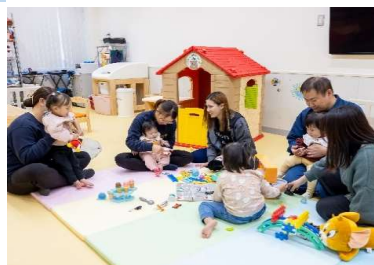
アサダキッズ(社内託児所)

また、事務所棟内には休憩時間にリラックスし休める様にスタイリッシュな食堂空間を完備しており、一人でゆったりと休めるラウンジチェアは休憩時間に仮眠をとることができます。その他にも、リフレッシュコーナーとして100円で購入可能なカップ麺、サラダ等も設置されています。