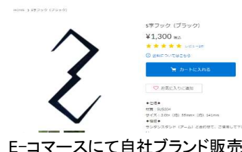
E-コマースにて自社ブランド販売