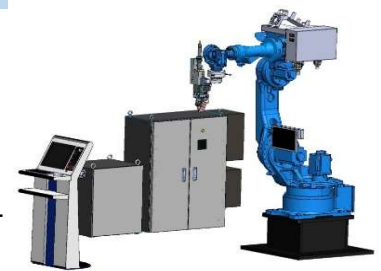
レーザ溶接ロボットシステム

レーザ溶接ロボットを導入し、レーザ連続発振による溶接や断続発振による溶接が可能となりました。溶接ビードにむらがなく気密性が高いのが特徴で、優れた外観の高品質溶接が可能です。また急熱急冷による凝固割れが発生しないために、アルミの溶接にも最適です。また、波形制御により、熱影響を最小限に抑えて溶接することが可能です。薄板や、微細な形状の溶接に適しています。その他、深溶け込み・強度の高いキール溶接やR形状の滑らかな溶接も可能です。半導体関連部品や装置金物・多ロット製品のご用命があれば是非お問い合わせ下さい。