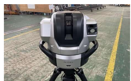
ワイドエリア三次元測定機