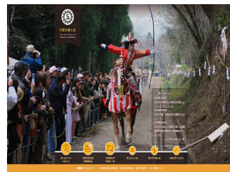
HP制作-曾於市商工会様

【サーバ・インフラの設計、構築、運用】サーバ・インフラ設計・サービス選定から、構築、監視、移行、セキュリティ施策等ご提案し、効率的で安定したサーバ運用の実現を支援します。