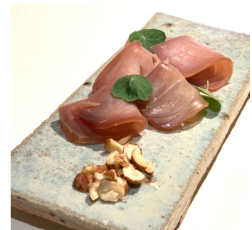
串木野まぐろブレザオラ