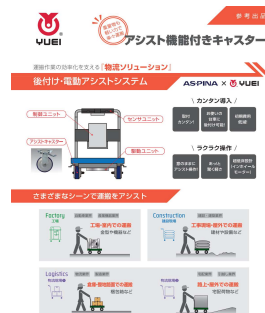
アシスト機能付きキャスター

運搬作業の肉体的負荷を軽減し、効率化を支える物流ソリューション構築商材として、拡大に期待しています。