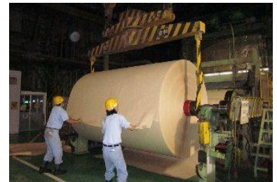
集荷した竹から生産した「竹紙」

鹿児島県は竹林面積日本一、タケノコ生産量も全国2位を誇ります。「竹紙」は、タケノコの生産性向上のために伐採した竹の処分に苦慮していた生産者からの相談をきっかけに、竹の集荷体制を構築し、2009年より生産を開始しました。今では多くの方にご協力を頂き、年間約1万2千トンの竹を集荷しています。一方で、放置された竹林が森林や里山を浸食し、様々な問題を引き起こす「竹害」が全国的に問題となっています。今後も、大量の竹を持続的に使うことで、タケノコの生産性向上はもとより、森林や里山、生物多様性の保全など地域社会の課題解決を図ってまいります。