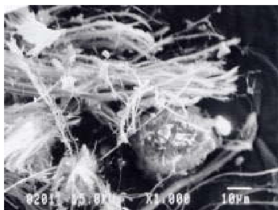
クリソタイル（白石綿）