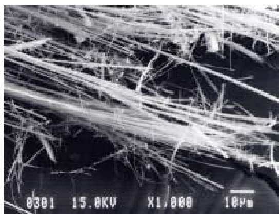
クロシドライト（青石綿）