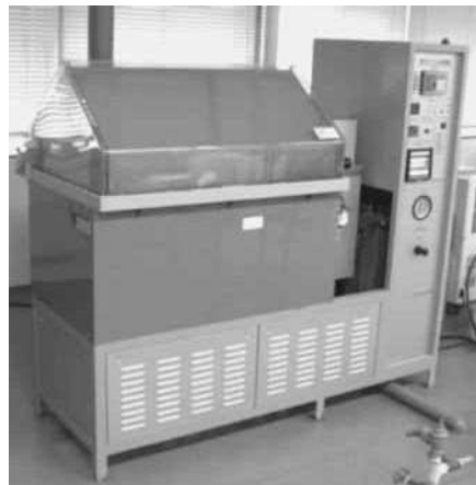
塩乾湿複合サイクル試験機