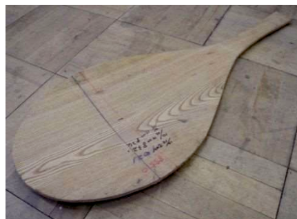
曲面成形したケヤキ無垢板(厚さ9mm)