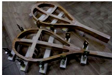
薩摩琵琶腹板(共鳴板)の成形治具