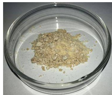
乾燥後の中間層 (糖濃度67%)