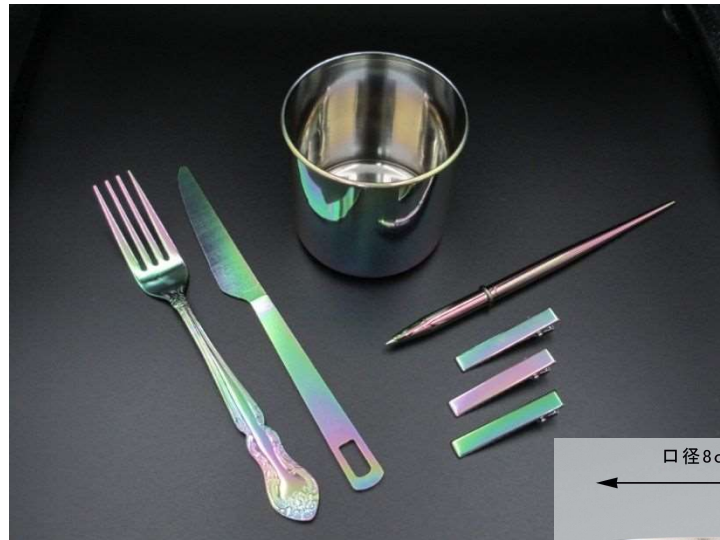
身のまわり品に 溶岩コーティングした試作例