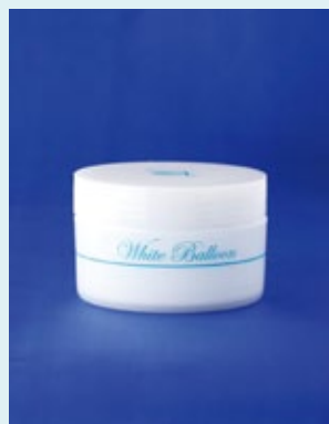
ホワイトバルーン ジャータイプ