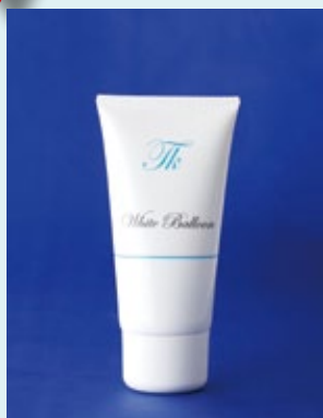
ホワイトバルーン チューブ

シラスの微粒子を配合した洗顔石けん 泡立てネットを必要としない簡単洗顔石けんです！