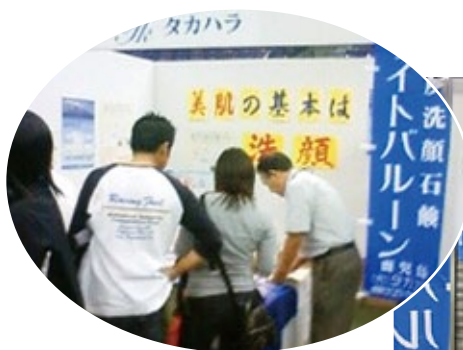
商標登録 登録第5109631号 (平成20年2月8日登録)