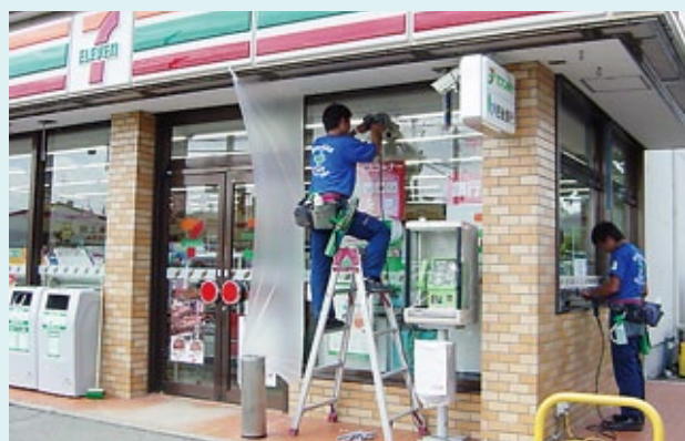
コンビニでのガラスリニューアル作業