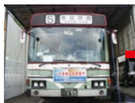
フロントガラス：使用前