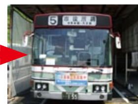
フロントガラス：使用后