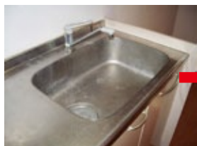
ステンレス：使用前