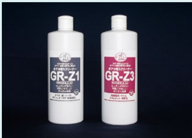
ガラスリニューアル剤「GR-Z1」 陶器等リニューアル剤「GR-Z3」

自然素材にこだわった独自の商品を開発しています。 特にガラス製品のリニューアルには高い評価を得ています。